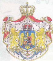
Regatul România 1922–1947