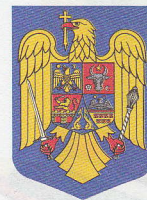
Republica România 1992–prezent